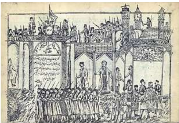
تصویر شماره ۲. تجمع میدان بهارستان، منبع: روزنامه آینه غیب‌نما، ش ۲۳.

در مقابل، فردای آن روز اجتماع بزرگی از مشروطه‌خواهان در مجموعه بهارستان شکل گرفت. عمارت بهارستان، میدان روبروی آن، و مدرسه سپهسالار مملو از جمعیت شد. در نتیجه این رویداد دو قطب مشخص به مرکز بهارستان و توپخانه در شهر ظهور یافت (اهری و دیگران، ۱۳۹۴: ۸۰). هر انجمن یکی از حجره‌های مدرسه، که فضایی وسیع و روشن داشت، را گرفته و تابلوی خود را بر سردر آن آویزان کرده بود. به این ترتیب تجمع مدرسه سپهسالار همان شکل آشنا را به خود گرفت؛ طرفداران مشروطه با ایجاد شکافی در دیوار میان مدرسه و باغ بهارستان، این دو بخش را به هم متصل کردند تا عبور و مرور میان این دو مکان آسان‌تر شود (دولت‌آبادی، ۱۳۶۲: ۱۷۰). به این ترتیب، فضای دو میدان شکلی نظامی و امنیتی به خود گرفت. تجمع بهارستان شاه را ناچار به برچیدن اجتماع میدان توپخانه مجبور کرد (رحمانیان، ۱۳۹۰: ۱۲۶).