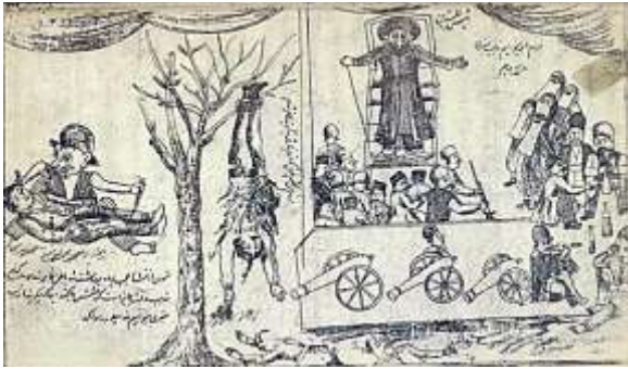
تصویر شماره ۱. تجمع میدان توپخانه، منبع: روزنامه آینه غیب‌نما، ش ۲۳.

در مقابل، فردای آن روز اجتماع بزرگی از مشروطه‌خواهان در مجموعه بهارستان شکل گرفت. عمارت بهارستان، میدان روبروی آن، و مدرسه سپهسالار مملو از جمعیت شد. در نتیجه این رویداد دو قطب مشخص به مرکز بهارستان و توپخانه در شهر ظهور یافت (اهری و دیگران، ۱۳۹۴: ۸۰). هر انجمن یکی از حجره‌های مدرسه، که فضایی وسیع و روشن داشت، را گرفته و تابلوی خود را بر سردر آن آویزان کرده بود. به این ترتیب تجمع مدرسه سپهسالار همان شکل آشنا را به خود گرفت؛ طرفداران مشروطه با ایجاد شکافی در دیوار میان مدرسه و باغ بهارستان، این دو بخش را به هم متصل کردند تا عبور و مرور میان این دو مکان آسان‌تر شود (دولت‌آبادی، ۱۳۶۲: ۱۷۰). به این ترتیب، فضای دو میدان شکلی نظامی و امنیتی به خود گرفت. تجمع بهارستان شاه را ناچار به برچیدن اجتماع میدان توپخانه مجبور کرد (رحمانیان، ۱۳۹۰: ۱۲۶).