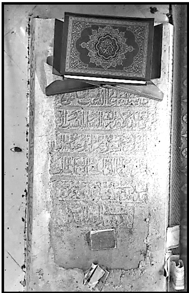
شکل ۲. سنگ مزار امامزاده نصرت‌الدین در محله سنگ‌سیاه بافت تاریخی شیراز

براساس این کتیبه و نیز نزدیکی مزار سیبویه به دروازه کازرون، محدوده جنوب غربی شهر مشخص می‌شود و حد غربی را نیز در نزدیکی مقبره امامزاده بی‌بی دختران در همان گورستان باهلیه که در داخل شهر قرار داشت، می‌توان در نظر گرفت (عیسی‌بن‌جنید شیرازی، ۱۳۶۴، ص ۱۳۹ و ۱۵۴). به نظر می‌رسد که دروازه‌های بیضاء (غربی) و نیز موردستان (شمال غربی) در طول تاریخ، جابجایی محسوسی نداشتند. دروازه شمالی نیز در نزدیکی مزار شیخ کبیر در گورستان شیخ کبیر قرار داشت (شکل ۲).