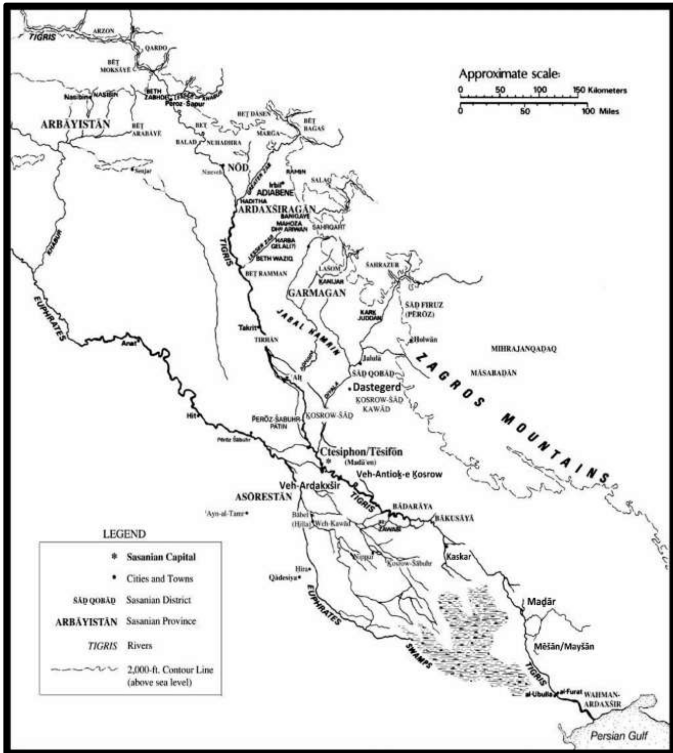
نقشه ۱. خوربران یا کوست غرب ساسانی مشتمل بر میان‌رودان و شهر مرکزی مدائن (Morony, 2012)