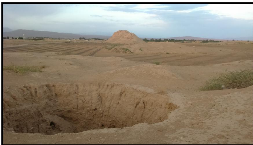
شکل ۲. محوطه تل ضحاک فسا، دید از غرب. (نگارندگان)