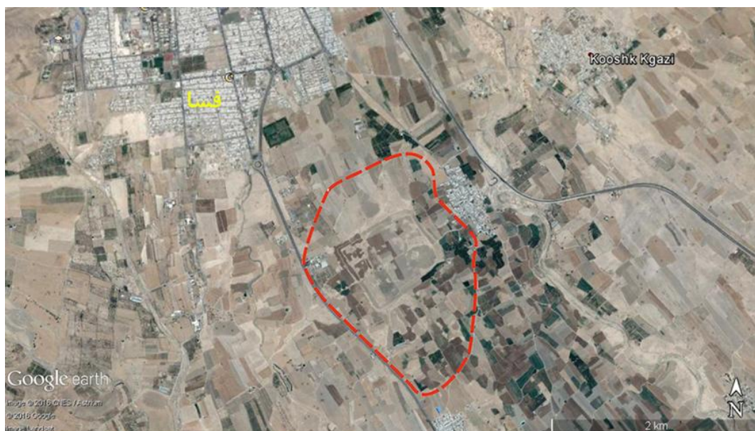
محدوده تقریبی شهر باستانی فسا