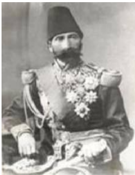
شکل ۲. حسنعلی خان امیرنظام گروسی در میانسال