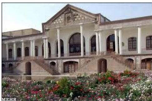
شکل ۴. خانه امیرنظام گروسی در تبریز به هنگام پیشکاری آذربایجان