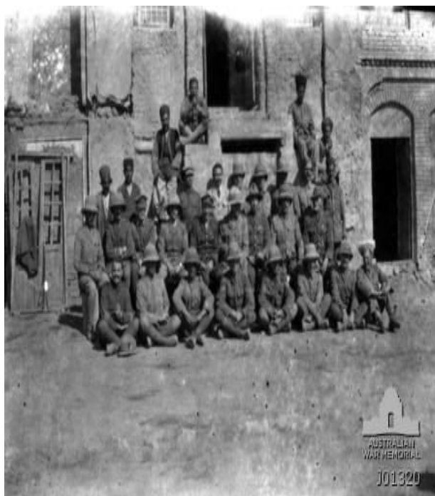
شکل ۸. تصویر گروهی از کارمندان و افسران انگلیسی در بیجار