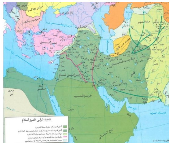
(مونس، ۱۳۸۵: ۲۶۲)

اطلس تاریخ اسلام اثر حسین مونس از مشهورترین و معتبرترین اطلس‌های عربی است که نقشه‌های آن بیانگر سیر گسترش اسلام در همه مناطق جهان است. بخشی از نقشه‌های این اطلس به دولت‌های اسلامی مستقر در ایران اختصاص یافته است. با این که مونس در نخستین نقشه مربوط به ایران به حکومت طاهریان، توجه نشان داده اما وی سیر گسترش اسلام در طول ۲۰۰ سال نخست را با حوزه قلمرو طاهریان در یک نقشه ترسیم کرده است. همین مسأله سبب شده تا نقشه وی ترکیبی و کلی و فاقد دقت لازم شود.