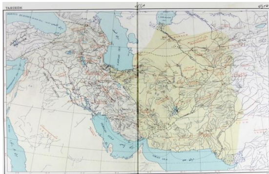
(اطلس تاریخی ایران، ۱۳۵۰: ۹)

اطلس تاریخی ایران، نخستین اطلس بزرگ ایرانی است که در سال ۱۳۵۰ با همکاری گروهی پرشمار از پژوهشگران معاصر تدوین شد. یک نقشه از این مجموعه به جغرافیای تاریخی حکومت طاهری اختصاص یافته است. اطلس ملی ایران که در سال ۱۳۷۸ ش توسط سازمان نقشه‌برداری کشور تهیه و منتشر شد نیز در بیشتر موارد مبتنی بر الگوی نقشه‌های اطلس یادشده است.