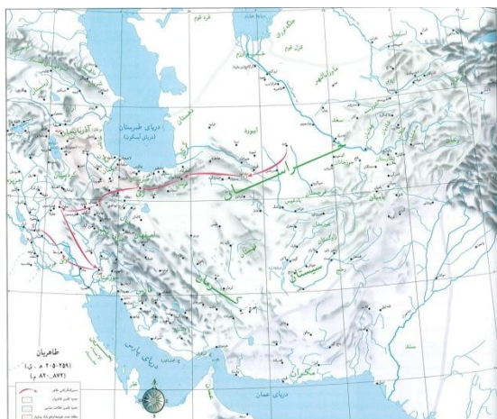
(سازمان نقشه‌برداری کشور، ۱۳۷۸: ۵۹).

کتاب جغرافیای مرز، نقشه‌های دو اطلس قبلی را با